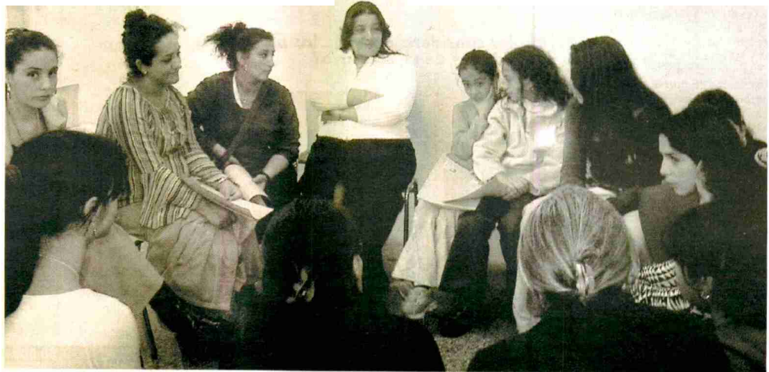
Mujeres gitanas durante el III Encuentro Educativo celebrado en Terrassa

En Catalunya hay unos 70.000 gitanos y en España superan el medio millón de personas