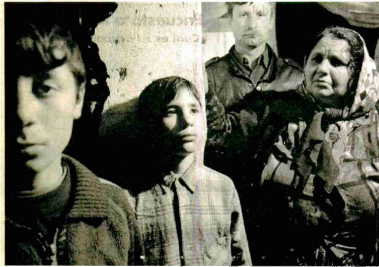
Una familia gitana, llegada de Rumanía, que se instaló cerca de la avenida Meridiana

lugar a los gitanos que por su menor formación han sufrido el cierre de las empresas y la reducción de los servicios sociales. Muchos no han conseguido reinsertarse laboralmente, debido a que los oficios tradicionales que conocen ya no están en boga. Están intentando una reconversión laboral. Hacen programas con grupos locales, para poner en marcha proyectos generadores de beneficios a través de cooperativas mixtas y ayuntamientos. Para uno de los oficios tradicionales, hacer ladrillos, se les facilita la inversión primaria para la compra de la maquinaria y