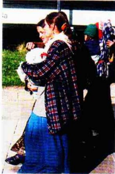
Alrededor de 10 millones de gitanos viven en Europa.