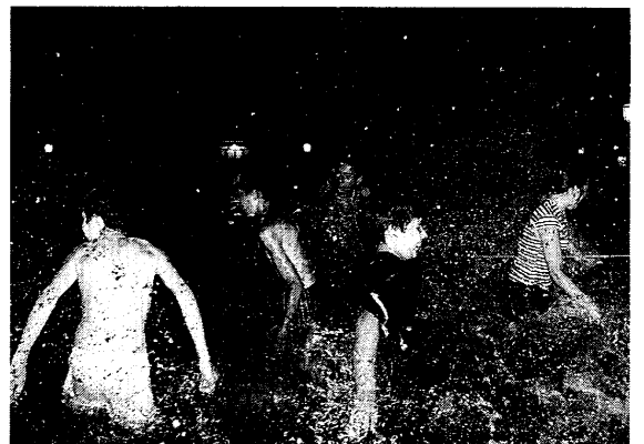
CONVIVENCIA FELIZ. Gitanos y payos disfrutaron de esta fiesta y todos mojaron sus varas para tener un buen año.