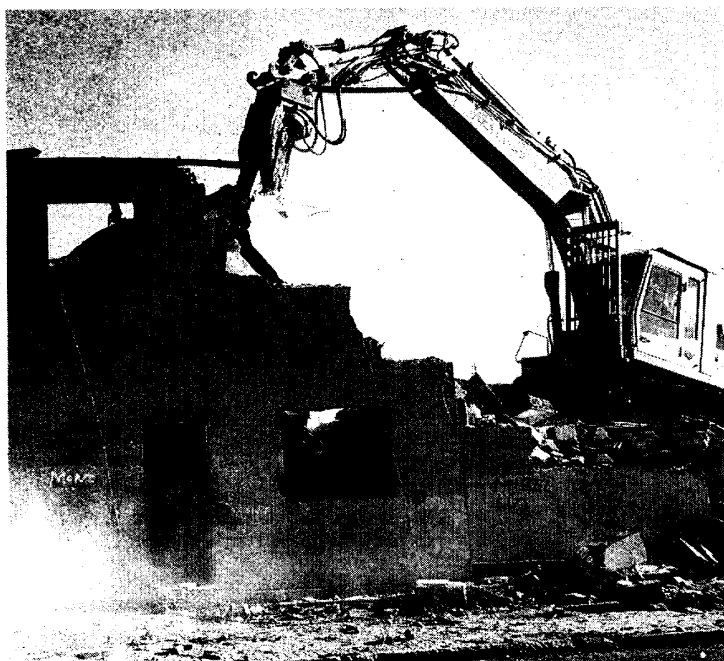
Las últimas 25 chabolas de Pozo del Huevo desaparecerán este mismo año

obstante, los objetivos más inmediatos son acabar con dos de los núcleos más grandes de la capital. Uno de los que está en plena cuenta atrás es El Salobral, el más representativo de Villaverde. Sus 20 hectáreas le convierten en el núcleo de infraviviendas más extenso de la región. La piqueta redujo a escombros el año pasado 64 construcciones y realojó a sus habitantes en viviendas en altura, por lo que quedan pendientes otras 150 que correrán la misma suerte. Debido a su envergadura no desaparecerá este año, sino en 2003, pero recibirá un empujón importante, al realojar a otras 80 familias, según las previsiones que baraja el consejero de Obras Públicas, Luis Eduardo Cortés, que lo considera «un punto y aparte y el empeño más complicado tras los retos alcanzados». Las ínfimas condiciones de habitabilidad e insalubridad del poblado, hacen que esta actuación sea considerada urgente. La tipología de sus construcciones es de lo más variopinto: además de las típicas chabolas tiene casas de labor, naves y segundas viviendas. Por ello, la primera labor