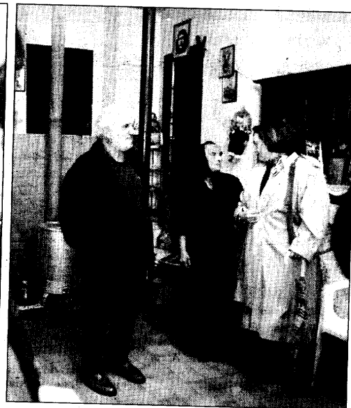
La delegada de Asuntos Sociais visitó el taller de peluquería y la guardería infantil del poblado de O Carqueixo, así como a la abuela de una gitana universitaria