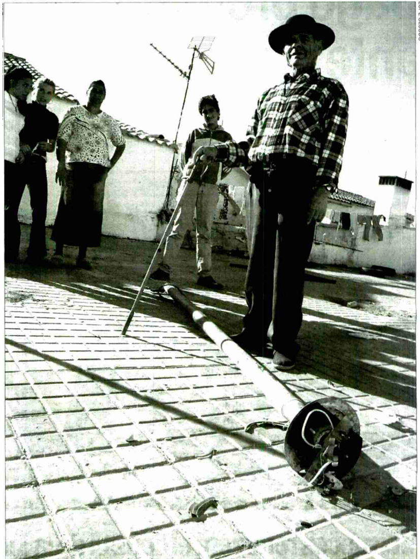
Vecinos de La Erita se arremolinan en torno a una farola destrozada por los manifestantes.

En la barriada de La Erita, los vecinos siguen sin explicarse lo sucedido. Según los propios inquilinos de la zona, la muchedumbre provocó destrozos en una treintena de coches y en 11 casas, incluyendo dos tejados desbarbolados. "Esto no es justo" protestan "no pueden pagar justos por pecadores". En La Erita todos piensan que ellos no tienen nada