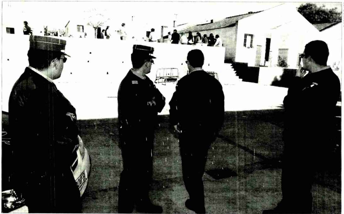
Cuatro agentes de la Guardia Civil vigilan la zona de La Erita en la tarde de ayer.

Por su parte, fuentes socialistas señalaron que los cinco concejales "llamaron a la calma a la población ante la ausencia del alcalde" y que fueron los únicos representantes del ayuntamiento que actuaron "de forma responsable" por lo que calificaron de "rotundamente falsas" las palabras de Valderas. ■