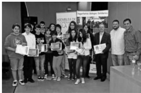
Alumnos y docentes que trabajaron en el plan 'Escolas sen racismo'. DP

daron en las aulas trabajos sobre el manifiesto de las escuelas sin racismo, las escuelas para la paz y el desarrollo y la Declaración Universal de los Derechos Humanos, tarea con la que se elaboraron murales y poemas.