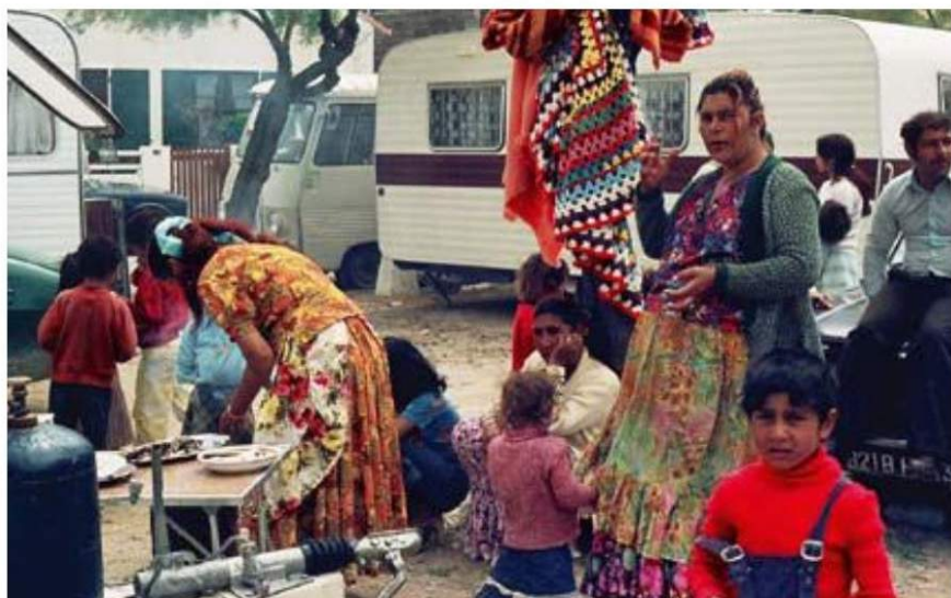
GRUPO DE GITANOS en su tradicional peregrinación a Santas Marías de la Mar, en la Camarga francesa.

La comparación de los genomas de los grupos gitanos revela diferencias en el comportamiento de estos en cuanto a su relación social con las poblaciones no gitanas. Mientras que los de los Balcanes muestran poca mezcla genética con poblaciones «payas» (un 7,5 por ciento de su genoma es de origen europeo), los grupos más distantes, como los de la península Ibérica o los países bálticos, son los que han recibido más influencia genética de las poblaciones vecinas (alrededor de un 15 por ciento). Curiosamente, los fragmentos cromosómicos no gitanos incorporados en los grupos gitanos de los