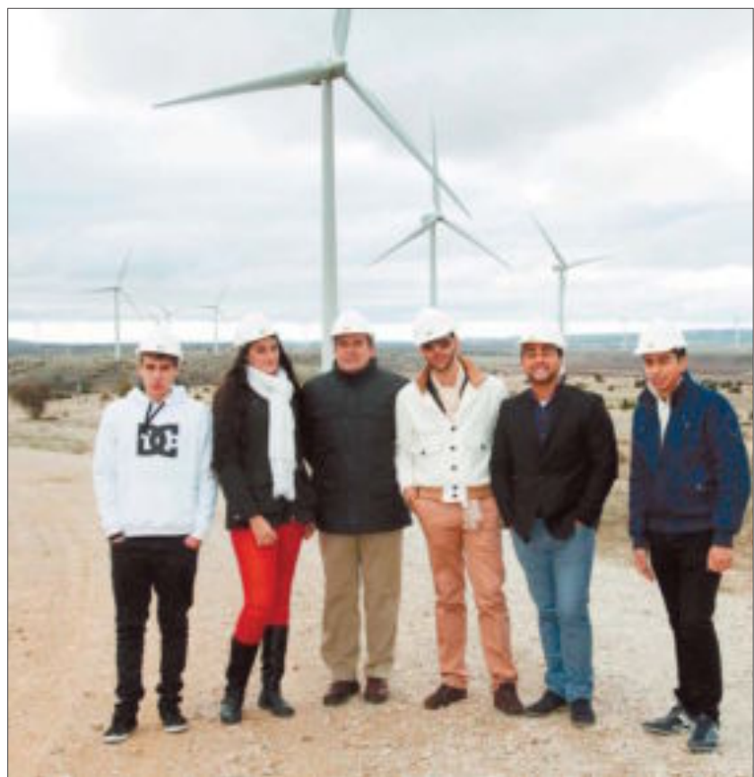
El joven burgalés (a la derecha), junto a otros compañeros.

Dicho plan recoge el compromiso de la empresa de impartir formación complementaria para facilitar la inserción laboral de colectivos desfavorecidos. Asimismo, contempla fomentar la contratación de jóvenes en su primera experiencia profesional y potenciar la contratación indefinida. Con ese fin, Iberdrola celebró una jornada de mentoring para dar a conocer a un grupo de jóvenes