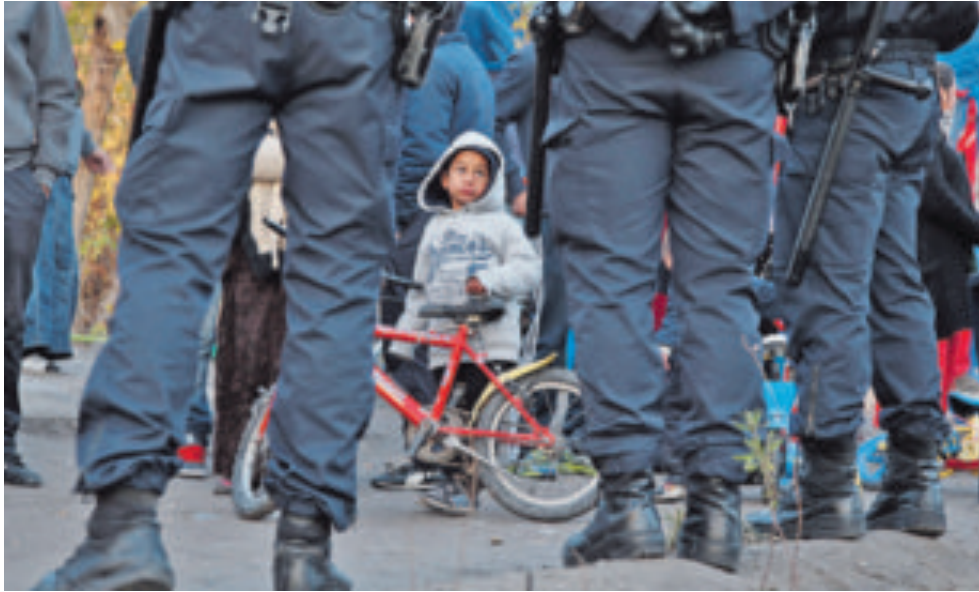
Un niño del campamento de Saint-Ouen, del que la policía desalojó a 800 gitanos.