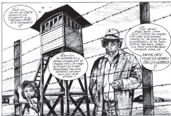
Viñeta del cómic Tsiganes , de Kkriss Mirror.

Montreuil-Bellay había cerrado mucho antes, recuerda Kkriss Mirror: "Cuando trasladaron a los gitanos, el director del campo, un petainista convertido en resistente, decidió encerrar a las prostitutas de la zona y se puso a regentar el burdel. La epidemia de sífilis fue tan brutal que las mujeres de los pueblos exigieron que se cerrara el campo".