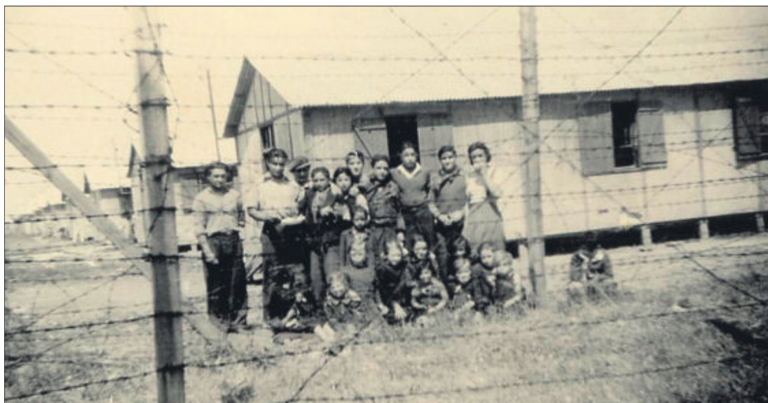
Prisioneros en el campo de Montreuil-Bellay, en 1944.