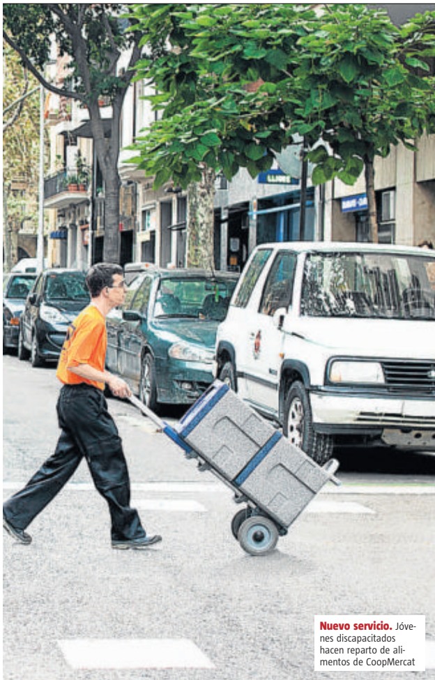
Nuevo servicio. Jóvenes discapacitados hacen reparto de alimentos de CoopMercat

La variedad de iniciativas permitía pasar de un programa para mejorar las tasas de éxito del alumnado gitano (Fundación Secretariado Gitano), el proyecto EFICI Dones, para mujeres en situación vulnerable en Salt (Fundació Plataforma Educativa), un programa de tratamiento de toxicomanías en el Centre Penitenciari de Lleida (Fundació Salut i Comunitat) o un proyecto de limpieza y conservación de bosques en el Alt Empordà (Minyons Escoltes).●