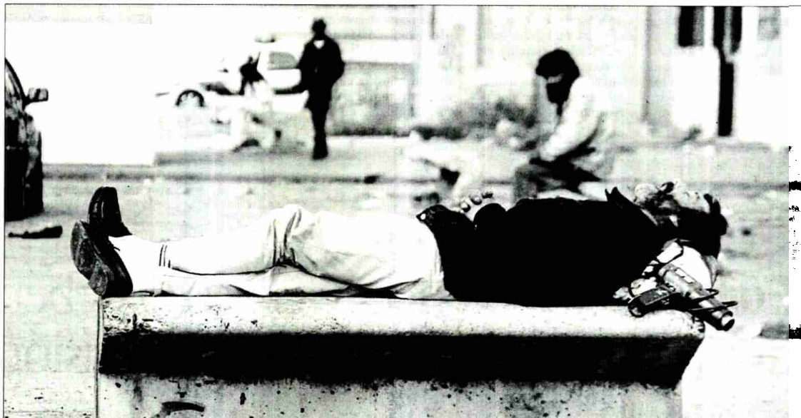
EN LA CALLE. Un indigente duerme en un banco situado en una plaza de la barriada Martínez Montañés.

► APOYO A LAS EMPRESAS. "La actividad productiva de las empresas de la zona supone el motor de crecimiento más importante", se lee en el plan. El objetivo es aflorar la economía sumergida, con nueve medidas como el apoyo a las inversiones que generen empleo; el inicio de programas de cooperación empresarial; el impulso al uso de las infraestructuras y el suelo industrial, o planes contra la siniestralidad laboral. Es también fuente de empleo: el trabajo que genera, por ejemplo, la rehabilitación de pisos de Martínez Montañés, atrae a empresas que comienzan a contratar a vecinos porque la Junta los obliga en sus cláusulas sociales -hasta en un 25%- . Doble beneficio: el trabajador se cualifica y entra en el círculo del empleo; y el dinero comienza a entrar en el barrio, agitando la economía.