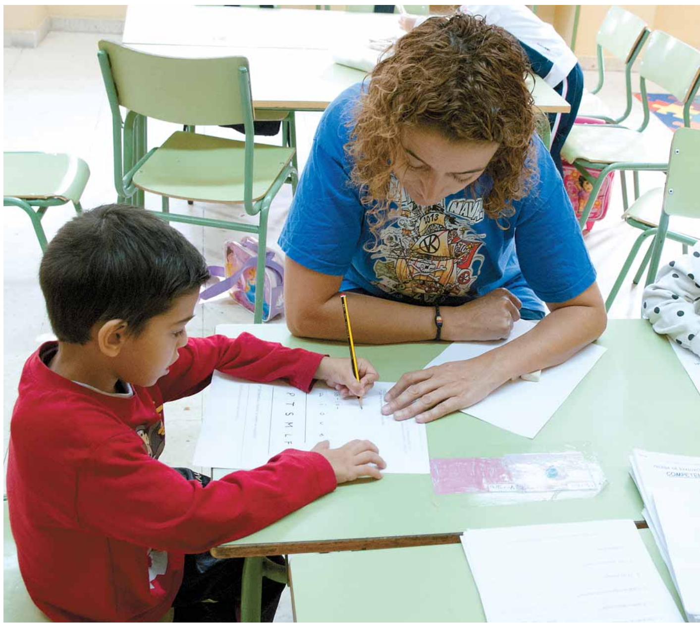
De los 110 niños que forman el alumnado del Colegio "Manuel Núñez de Arenas, calificado como de Díficil Desempeño, el 80% son de etnia gitana.

La implicación de las familias en la Educación de sus hijos es un mantra para el centro, y no dejan de fomentar su participación, aunque el grado siempre es más bien bajo. Acuden a las reuniones de manera irregular, son pocos los padres que participan en los talleres