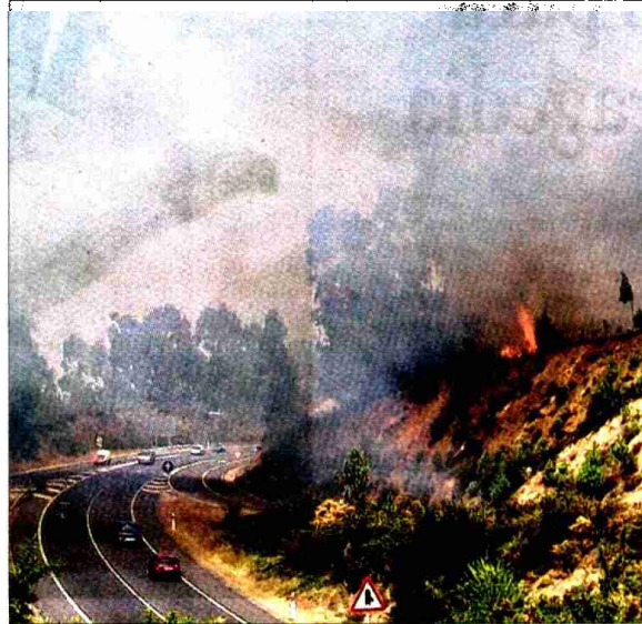
El fuego cortó la vía rápida, AP-9 y otras carreteras.

viento llegaba hasta O Grove, donde era apreciable en piscinas como la urbana de Confin o la del Hotel Amandi.