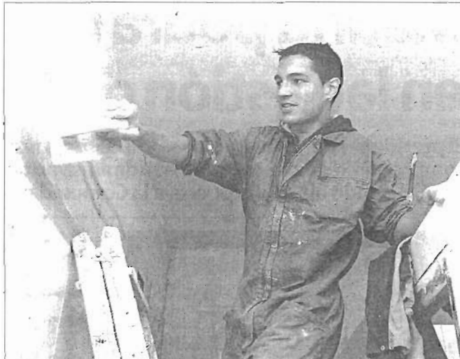
En la fundación existen numerosos talleres donde los gitanos pueden aprender un oficio y luego optar a cualquier puesto laboral.

El día a día no es fácil, pero los problemas no son tan frecuentes como puede parecer a los que viven ajenos a esta situación. La Fundación Secretariado Gitano (FSG), con siete sedes en la capital, trabaja para lograr una convivencia e integración cada vez mejor. El objetivo fundamental de esta entidad, cuya constitución se produjo en 2001 aunque ya venían trabajando desde los años 60, pasa por conseguir que los gitanos sean ciudadanos de pleno derecho y de pleno deber. "Queremos que sean como el resto de los ciudadanos, sobre todo en cuestiones de convivencia".