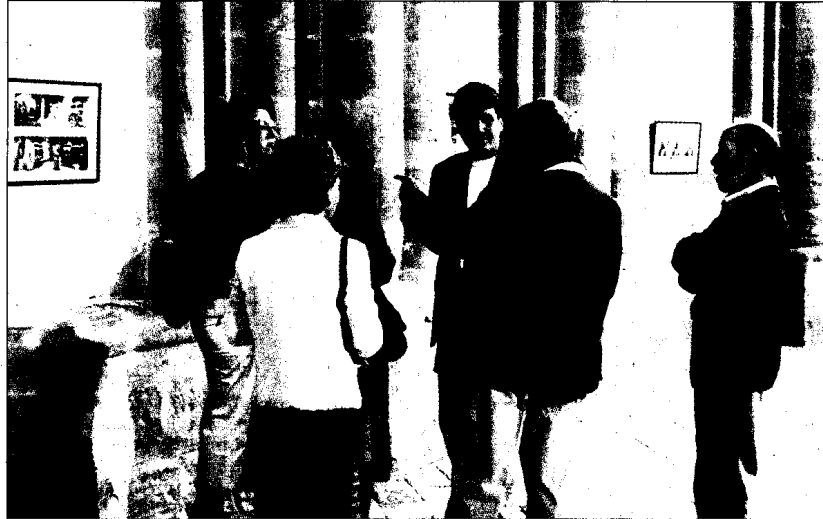
Recorrido por la exposición sobre la mirada fotográfica de alumnos del CRA de Lanaja. PABLO SEGURA

Asimismo, se ha pretendido una vez más que la celebración