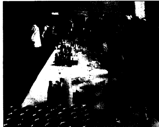
El aperitivo fue una degustación de comida magrebí. PABLO SEGURA