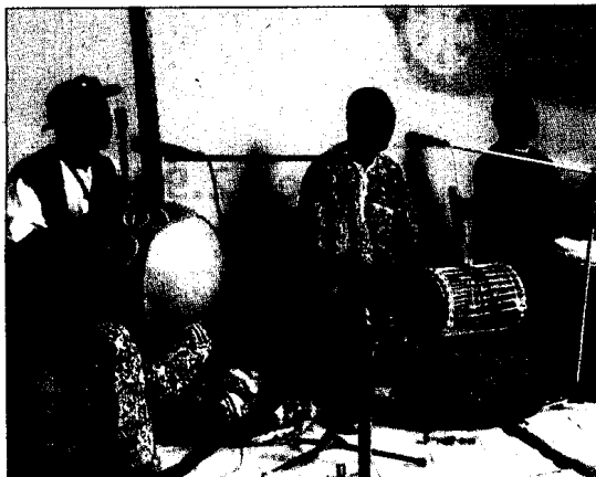
Los participantes disfrutaron también de la música subsahariana. PABLO SEGURA

Respecto al programa didáctico del Museo, Baldellou explicó que se está a la espera de poder contar con personal especializado en pedagogía para llevarlo a cabo.