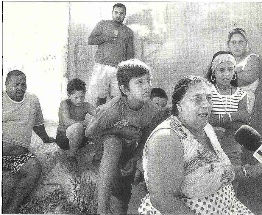
INTEGRACIÓN. Las Organizaciones Gitanas Andaluzas piden que se normalice su aparición en los medios.

EL PRIMER BALANCE: 65.000 NOTICIAS EXAMINADAS