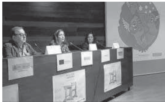
Autoridades y representantes de la FSG.