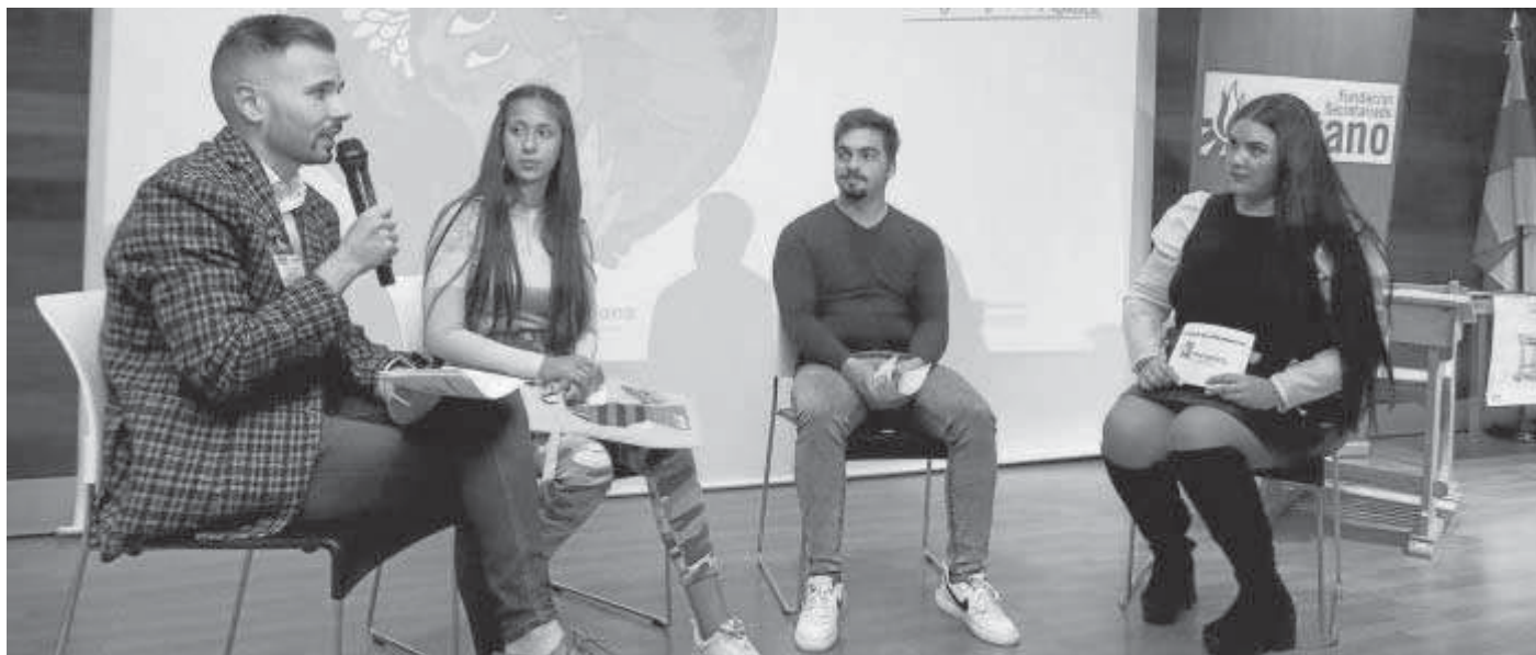
Mesa redonda del acto celebrado ayer en el Museo de Almería.