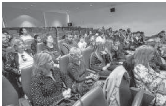
Algunos de los asistentes al acto.

Pero en realidad, sí que existe la necesidad de potenciar las capacidades y cualidades de los alumnos gitanos. La gran brecha educativa de los alumnos se