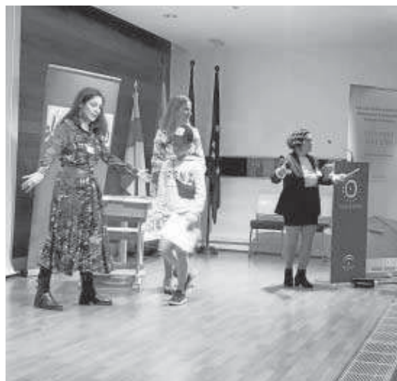
Reparto de diplomas.