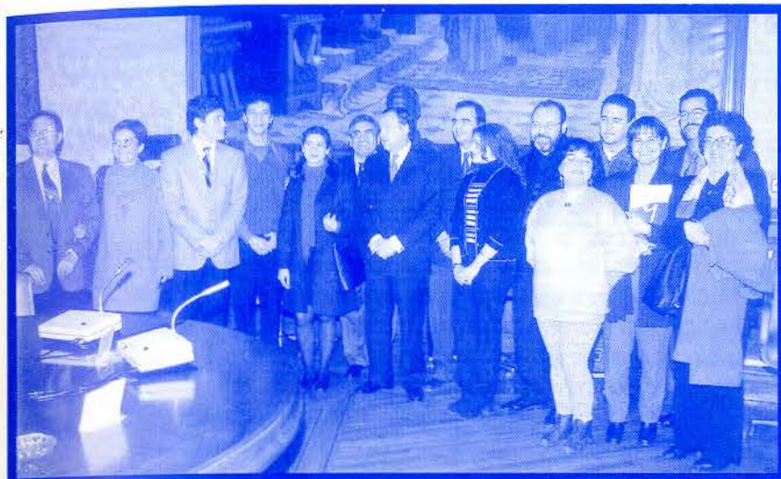
Se han puesto en marcha cuatro equipos de mediadores, compuestos por 12 profesionales, gitanos y no gitanos, y más de 20 colaboradores y voluntarios.

convivencia interétnica. Los aspectos prioritarios de la intervención son: la escolarización, y la canalización de necesidades a recursos normalizados.