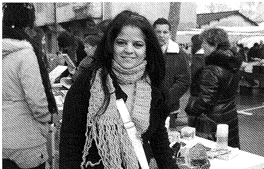
Krystalek Erandioko Elkartasun Azokan jarri zuen postua

—Ijito herritarrentzat behar egiten dugu, eskolari dagokionez batez ere. Ijito herria ikasten eta hezitzen jarraitzea bultzatzen dugu, hori oso garrantzitsua da eta. Heziketaren garrantzia ikusarazten saiatzen gara, eta gero eta lagun gehiago dabil ikasten.