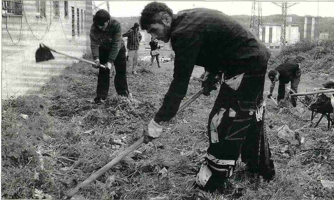
► Jóvenes de poblado gitano de Granda realizando labores de limpieza.