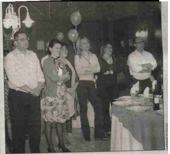
Al acto acudieron varios representantes de la Ciudad Autónoma