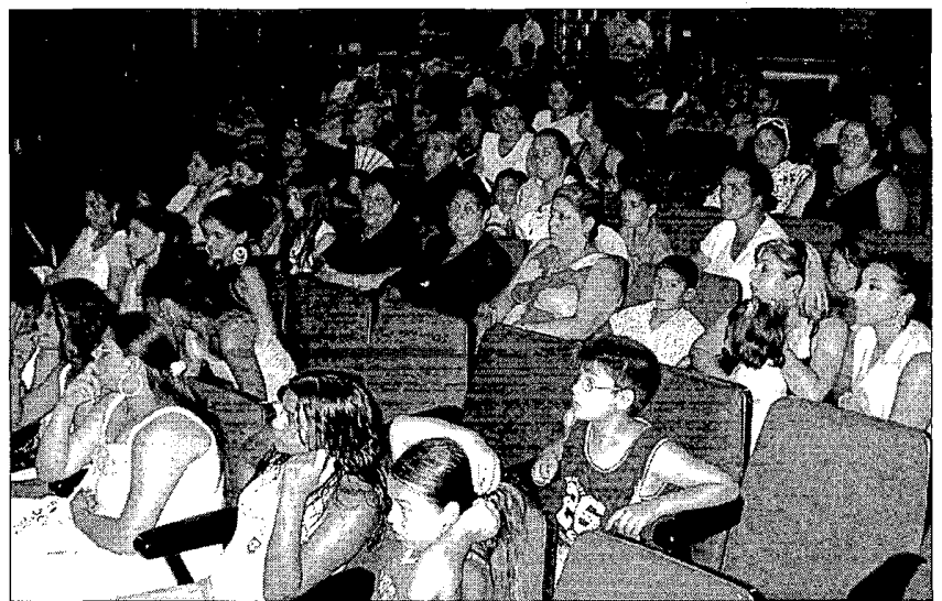
Numerosas personas asistieron a la Casa de la Cultura para ver los ensayos.

con los gastos que ello conlleva, y aportando una pequeña subvención para el alquiler de los equipos de luz y sonido.