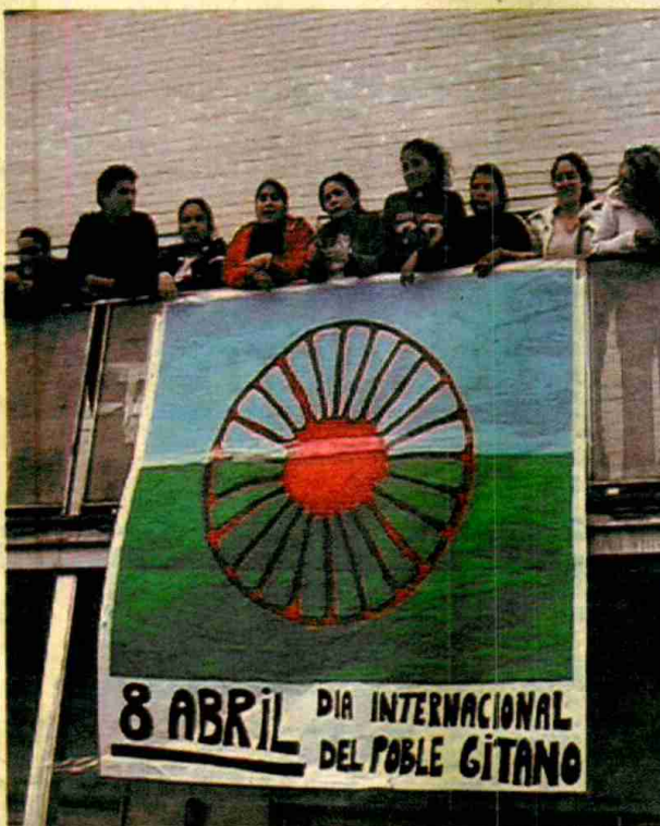
→ La comissió de la cultura gitana lluita contra tòpics que han fet molt de mal.

Per a molts d'ells, ser gitano i viure a la Font de la Pólvora ha de ser motiu d'orgull, malgrat els prejudicis