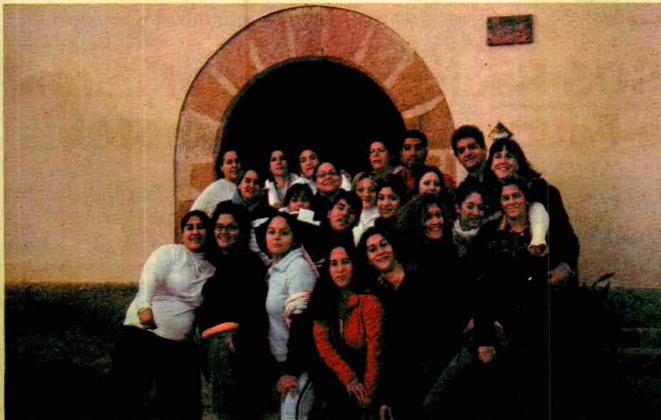
→ Els nois i les noies del barri han trobat un espai per expressar-se i discutir sobre les seves preocupacions.

em imaginat; hem après a relacionar-nos amb la gent, a sortir i a parlar... a anar soles a Girona, cosa que fins fa poc ens semblava impensable». Ella té 20 anys i és al grup des del principi. Coneix el barri la mar de bé i, mirant enrere, parla dels primers Joves.com com els «revolucionaris». Explica que, sense el grup, «ara jo, i moltes altres noies, estariem tancades a casa, amb un marit al costat, anant de la feina a casa i de casa a la feina, o potser ni treballariem. Aquí, en canvi, se'ns han obert moltes portes». Fins i tot, diu entusiasmada, «hem anat a l'Alguer i a Eivissa, amb avió».