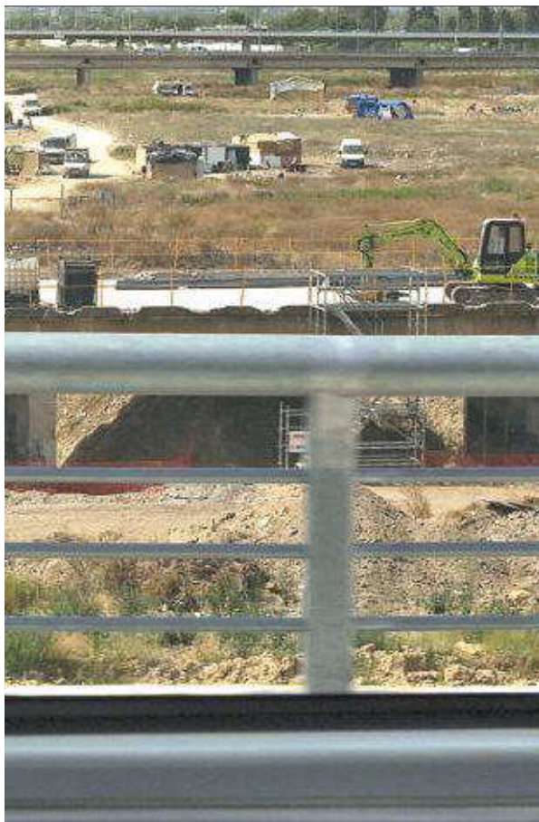
in de Aznalfrache, visto desde el metro de Sevilla.

mente, regresaron a los bajos del puente de San Juan. Donde comenzaron el éxodo meses antes.