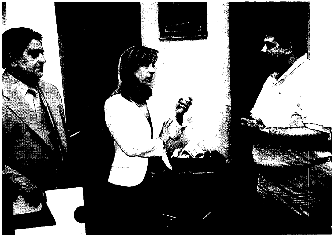
El Ayuntamiento ha firmado un convenio de colaboración con el Secretariado Gitano para poner en marcha esta muestra.

Para combatir esta realidad y otros problemas relacionados con la educación, la vivienda o el empleo, el Secretariado Gitano tiene en marcha diversos programas de acción, entre el que destaca el que el colectivo lleva a cabo con familias gitanas con idea de que sus hijos finalicen con éxito la Educación Secundaria Obligatoria. Aunque esta iniciativa está dirigida a alumnos tanto de primaria como secundaria, la alumna gitana suele cobrar un especial protagonismo, al entender que es la que está teniendo más inconvenientes a la hora de continuar su proceso educativo, implicando en todo momento a su familia