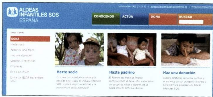
Una forma de colaborar con Aldeas infantiles es ser Madre SOS, un trabajo remunerado con la responsabilidad ser la "madre" de varios de estos niños.