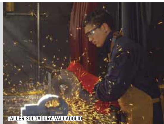
TALLER SOLDADURA VALLADOLID

El reconocimiento y promoción de su cultura, la discriminación directa e indirecta que padecen, la imagen social negativa que se tiene de ellos y la escasa sensibilización del conjunto de la sociedad hacia esta minoría, son cuestiones centrales que deben seguir siendo abordadas.