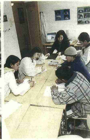
LA TEORÍA. La hora de hincar los codos.