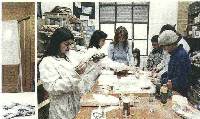
APRENDER UN OFICIO. Los alumnos de Garantía Social en una de sus clases prácticas.