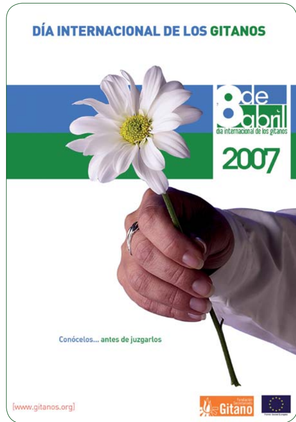
CARTEL DÍA INTERNACIONAL DE LOS GITANOS 2007

En la celebración del 8 de abril, Día Internacional de los Gitanos , se dio también en 2007 un importante impulso desde la FSG a las acciones de visibilización y promoción, con la difusión de un comunicado institucional, la habilitación de una sección especial o dossier en la web, la edición y distribución de un cartel en varias lenguas (español, inglés, romanés, catalán, vasco y gallego) y la concreción de un logotipo o seña de identidad de esta fecha que cada vez va teniendo más difusión tanto en España como en otros muchos países, y en la que numerosas