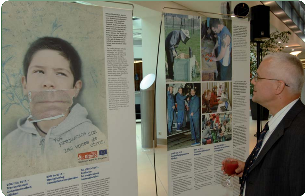
CAMPAÑA “TUS PREJUICIOS SON LAS VOCES DE OTROS” EN UNA MUESTRA DE LA COMISIÓN EUROPEA

El año 2007 ha supuesto un periodo de consolidación de las acciones de comunicación e imagen de la FSG con un importante impulso a las líneas de sensibilización social que se vienen realizando. Entre ellas destaca el lanzamiento, a finales de noviembre, de una nueva campaña publicitaria centrada en esta ocasión en el empleo.