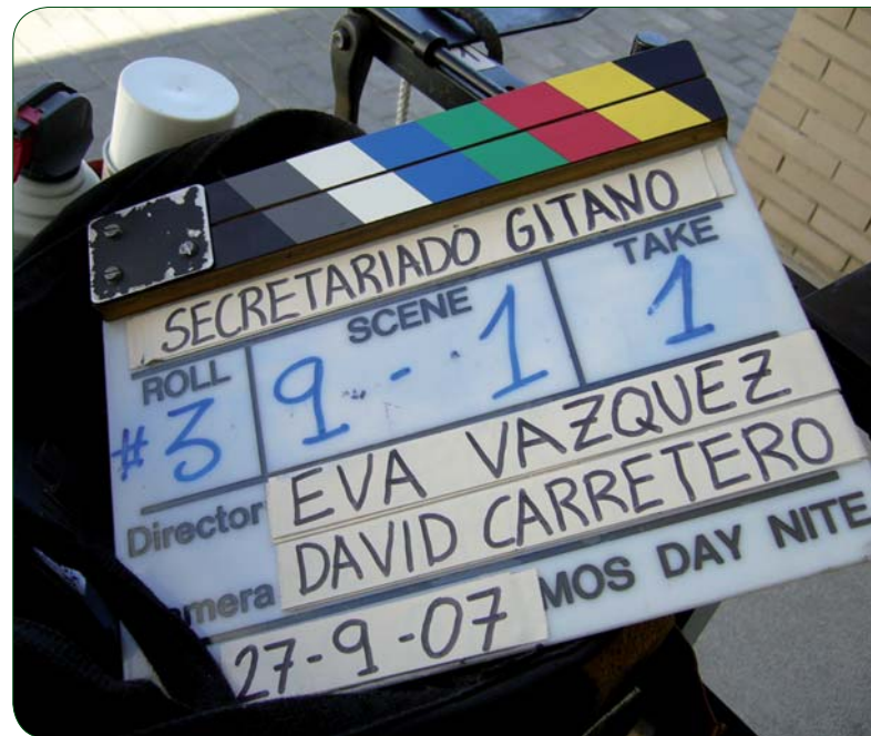
RODAJE DEL SPOT DE LA CAMPAÑA “EL EMPLEO NOS HACE IGUALES”

Este año implicó, en este sentido, un intenso trabajo en lo relativo a la planificación de las