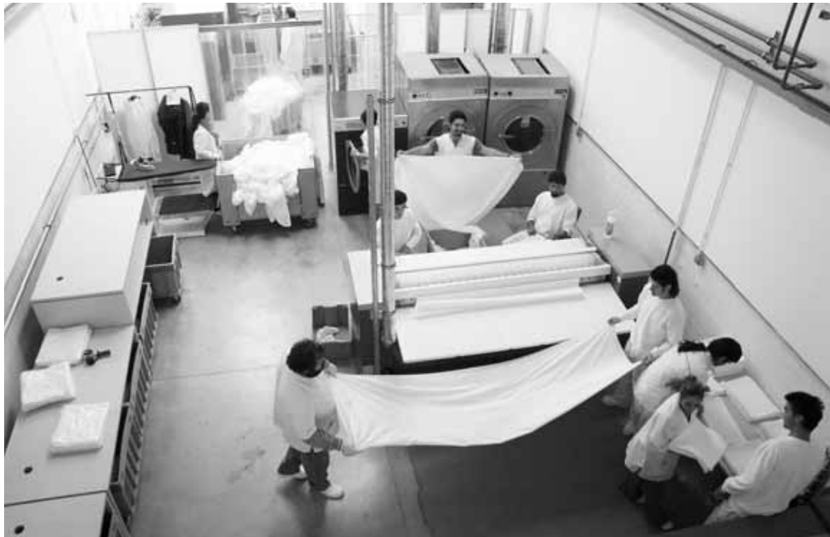
Trabajadores del CIS de Nabut en la lavandería industrial que tiene la empresa en el polígono Morea Sur de Beriáin.

En la actualidad, los once centros de inserción navarros dan empleo a cerca de 400 personas. Además, la mayoría son fundaciones más grandes que cuentan con distintas vías de inserción. De hecho, muchos son también centros especiales de empleo (CEES), dirigidos a insertar sociolaboralmente a personas con discapacidad.