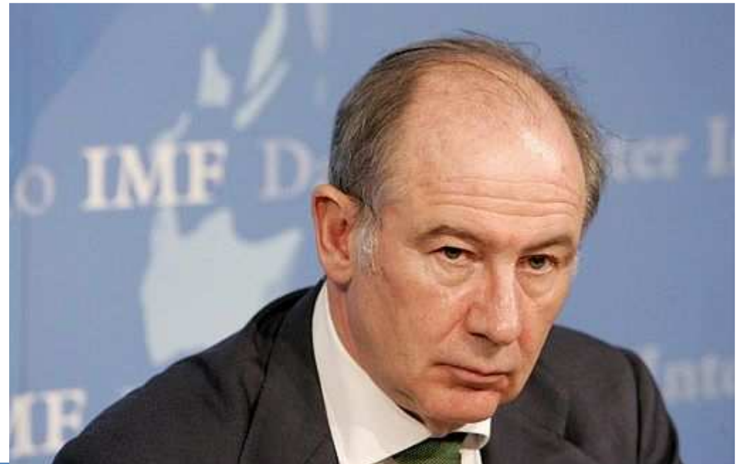
Dominique Strauss Kahn