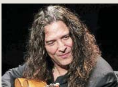
MANUEL CARRASCO CANTANTE

«No me atrevería a cantar nada de Camarón en público. Para mí, es un dios»