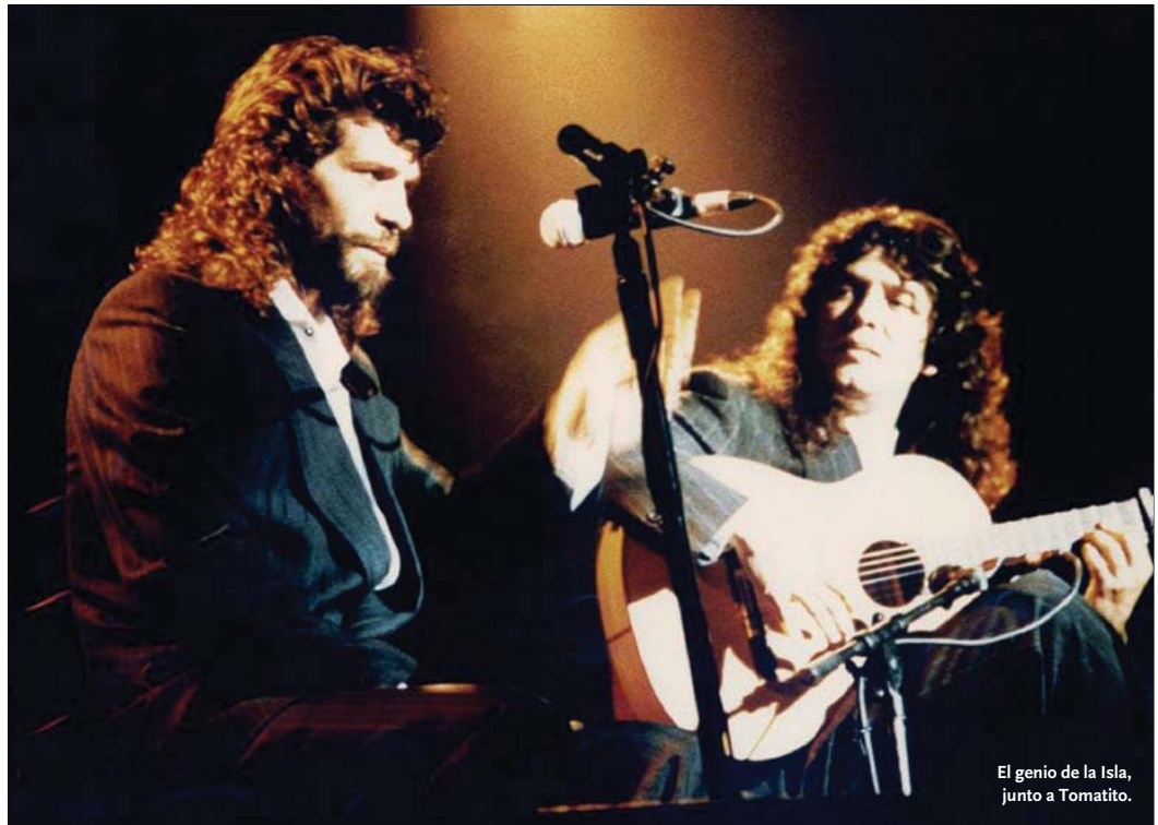
El genio de la Isla, junto a Tomatito.

LA NICOTINA. El genio de la Isla se alejó de los escenarios y consiguó, con ayuda profesional, abandonar los malos hábitos. Todos menos uno: el tabaco. Que fue, precisamente, el que acabaría con él. «José padece un cáncer casi imposible de ver por la cantidad de nicotina que tiene en los pulmones. Por eso no se lo han diagnosticado los médicos que lo han visto. Le queda poco tiempo de vida». Ése fue el duro diagnóstico que recibió su mujer, La Chispa , en marzo de 1992, es decir, poco antes de la muerte de Camarón, ocurrida el 2 de julio. Una fecha en la que murió el artista, pero nació el mito que, 25 años después, sigue más vivo que nunca.