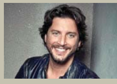
CURRO ROMERO TORERO

«Mi vida no hubiera sido lo mismo sin él. Puedo decir que toqué para un genio»