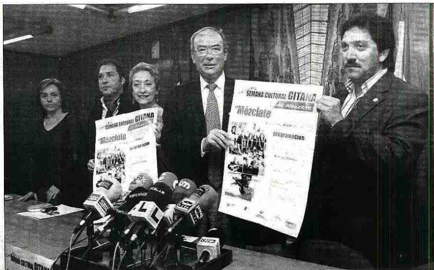
Imagen de la presentación de las jornadas en la sala de prensa del Ayuntamiento de Albacete. / CONSUELO LÓPEZ

El alcalde será reconocido como Quijote Gitano 2007 por su labor en favor de este colectivo