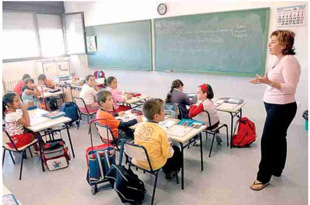
Alumnos de Primaria en clase.

La Ley de Educación de Andalucía, además de aumentar el número de horas lectivas de Lengua, Lectura, Inglés y Matemáticas, ha incluido en el temario de Primaria algunas nociones básicas relacionadas con aspectos culturales de la Comunidad. Entre ellas, la diversidad de hablas andaluzas y las manifestaciones lingüísticas con arraigo en Andalucía como el caló o lengua de la etnia gitana. Los escolares andaluces profundizarán en la diversidad de acentos que hay en la Comunidad utilizando como instrumento principal los mensajes de los medios de comunicación como la radio y la televisión. Los primeros alumnos que se han enfrentado ya a los nuevos contenidos son los de 6 y 7 años. El resto de escolares de Primaria los estudiarán a lo largo de 2008 y 2009.