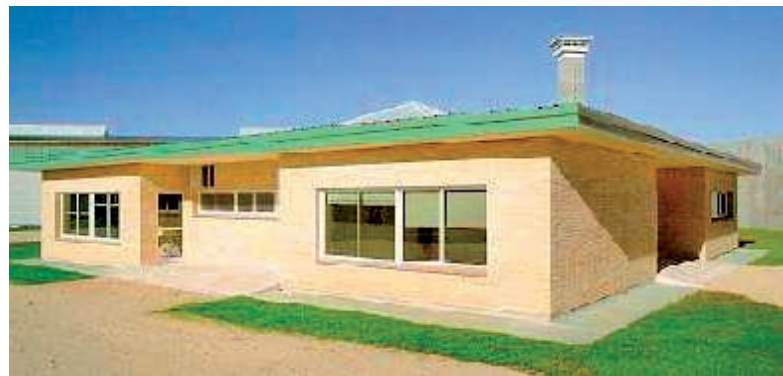
CENTRO PENITENCIARIO MADRID V

En el caso de la comunidad gitana penitenciaria, es fundamental realizar una intervención orientada al acercamiento a los recursos, la motivación, el acompañamiento y todo aquello que permita que el propio preso se implique en su proceso treatmental.