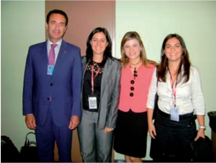
CON LA MINISTRA BIBIANA AÍDO EN LA ONU