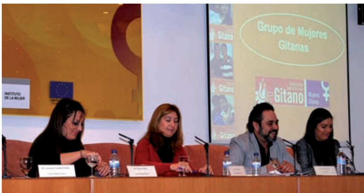
SEMINARIO LA IGUALDAD ES COSA DE TODAS Y TODOS

Es necesario sin embargo poner de manifiesto la situación de discriminación múltiple de la que se ven afectadas las mujeres gitanas como grupo étnico dentro de la sociedad española, padeciendo una situación diferente con respecto a la mayoría, viéndose afectadas en una triple faceta: por ser mujer en una sociedad patriarcal, por