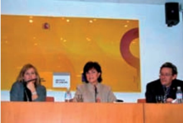
SEMINARIO LA IGUALDAD ES COSA DE TODAS Y TODOS

pertenecer a una minoría que recibe la peor valoración social y por estar inmersas en una cultura cuyos valores de género han estado tradicionalmente asociados a la función de madre y esposa, disminuyendo sus posibilidades de promoción.