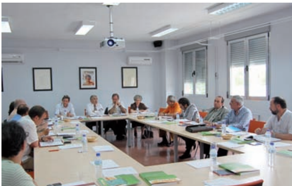
REUNIÓN PLENARIA DEL PATRONATO