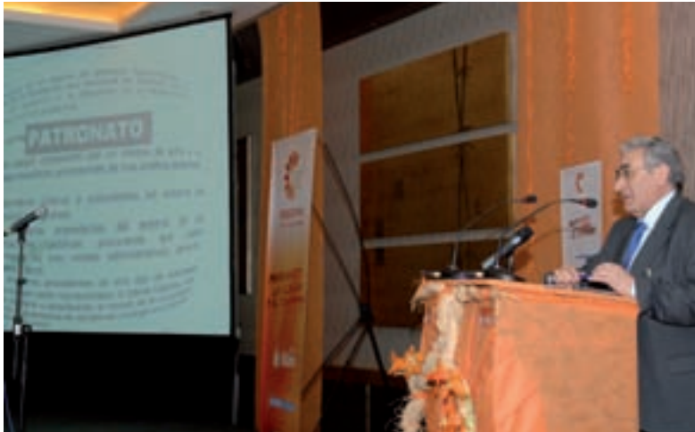
PRESENTACIÓN DEL PATRONATO EN EL I ENCUENTRO ESTATAL