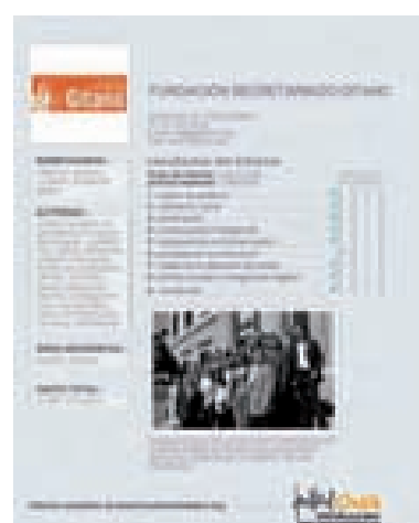
PÁGINA DE LA FSG EN LA “GUÍA DE LA TRANSPARENCIA Y LAS BUENAS PRÁCTICAS DE LAS ONG” EDITADA POR LA FUNDACIÓN LEALTAD.