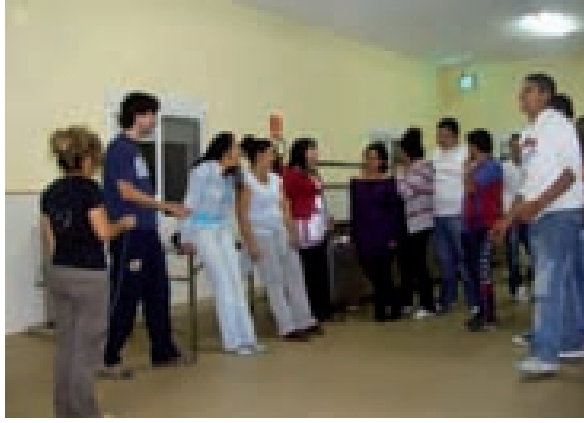
“CURSO DE FORMACIÓN DE MEDIADORES/AS EN UN CONTEXTO MULTICULTURAL – NIVEL I” – PUENTE DE RETAMA (CIUDAD REAL)