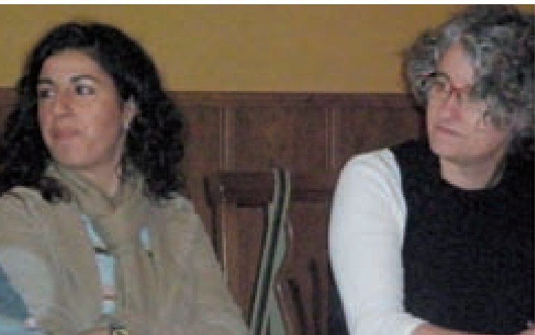
“CURSO DE MEDIACIÓN INTERCULTURAL EN EL ÁMBITO EDUCATIVO: TRABAJO CON FAMILIAS Y PROFESORADO” - GRANADA

Estas acciones se han dirigido a formar a personas que trabajan en el ámbito de la mediación con el propósito de que puedan desarrollar su labor profesional en el campo de la inserción sociolaboral e impulsar los servicios de proximidad a partir de la intervención en ámbitos como la educación, la salud, el empleo, la mediación en conflictos, o la promoción comunitaria entre otros. Estas acciones se han concretado en el desarrollo de varios cursos. Se han impartido tres cursos básicos en Barcelona, Valencia y Puente de Retama (Ciudad Real) de Formación de Mediadores en Contextos Multiculturales . Por su parte en Valladolid se desarrolló este mismo curso pero a nivel avanzado. También se ofreció un curso en Mediación e Intervención Familiar desde la Terapia Familiar Breve en Vigo, con el objetivo de dar respuestas eficaces y positivas a los nuevos retos que las familias tienen que afrontar.