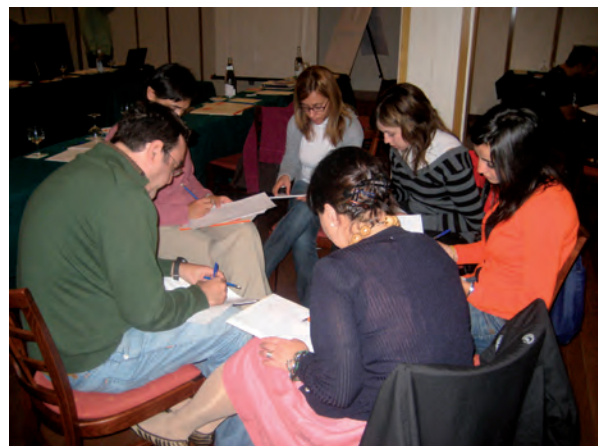
GRUPO DE TRABAJO EN LA FORMACIÓN “LA PREVENCIÓN FAMILIAR EN LA COMUNIDAD GITANA”.