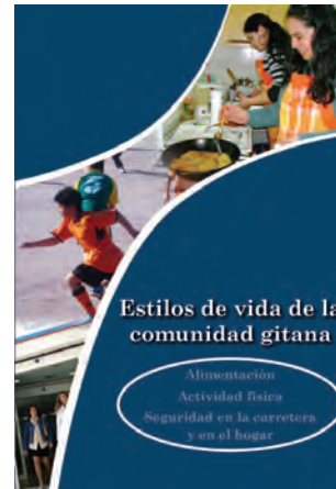
PORTADA DEL MATERIAL “ESTILOS DE VIDA DE LA COMUNIDAD GITANA”.

En colaboración con el Plan Nacional sobre Drogas se ha seguido desarrollando a lo largo de 2008 el Programa Romano Sastipen. Este programa, que se ha desarrollado en 28 localidades de 11 Comunidades Autónomas, pretende promover y apoyar el desarrollo de iniciativas de prevención y atención adaptadas a la población gitana, incrementar los factores de protección y disminuir los factores de riesgo de los menores y jóvenes gitanos, y facilitar el acceso y la atención de la población gitana en los recursos