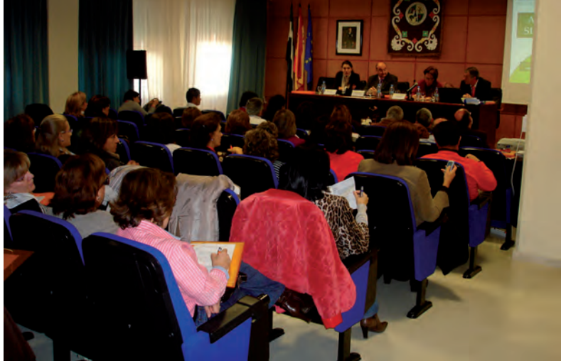
SEMINARIO “COMUNIDAD GITANA Y SERVICIOS SANITARIOS” ( CÁCERES)

En el ámbito de los programas desarrollados con el apoyo de los Planes Nacionales se han desarrollado además diferentes formaciones dirigidas a profesionales, que complementan las descritas anteriormente, entre las que destacan las siguientes. En el mes de octubre tuvo lugar en El Escorial (Madrid) el Seminario “La Prevención Familiar en la Comunidad Gitana”. Seminario en el que participaron 25 profesionales de la Fundación que trabajan la prevención del consumo de drogas con adolescentes y jóvenes gitanos. En noviembre tuvo lugar en Cáceres el Seminario “Comunidad Gitana y Servicios Sanitarios” en el que participaron 60 profesionales de los recursos públicos sanitarios y en diciembre tuvo lugar en Sevilla una formación sobre el trabajo con grupos y la incorporación del género en las intervenciones dirigidas a la promoción de la salud de la comunidad gitana. En la formación participaron 16 profesionales de la Fundación, la mayor parte de ellas mujeres gitanas que trabajan la promoción de la salud con grupos de mujeres