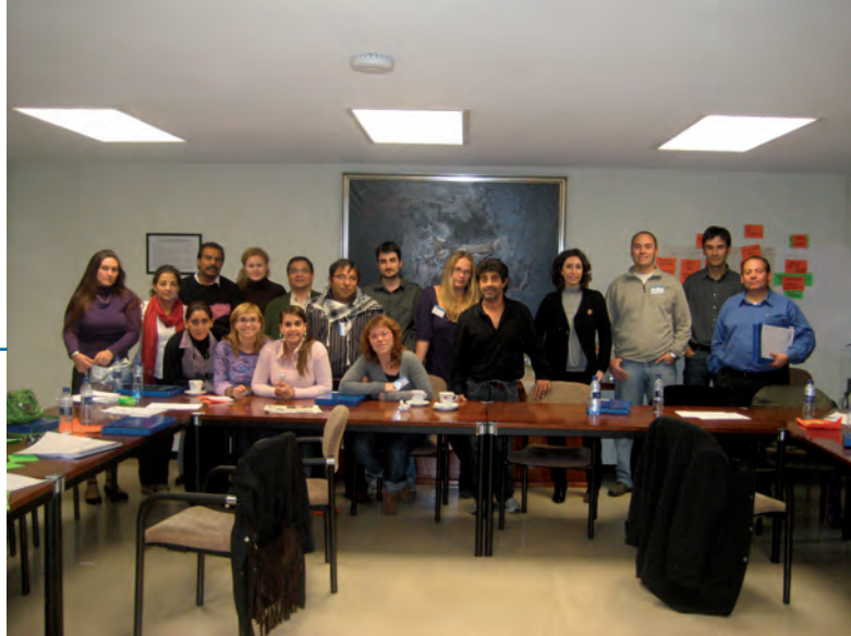
ASISTENTES A LA FORMACIÓN “EL ENFOQUE DEL MARCO LÓGICO APLICADO A PROYECTOS DIRIGIDOS A LA PROMOCIÓN DE LA SALUD DE LA COMUNIDAD GITANA”

En el año 2006 se planteó la oportunidad de llevar a cabo un estudio que permitiese conocer de manera objetiva la situación de la comunidad gitana en relación con la salud. Nuestro objetivo inicial era, no solo el de conocer la realidad de esta población, sino también, y de manera primordial, el de comparar los datos que se obtuviesen con la situación general del conjunto de la población española. A lo largo del año 2007 se publicó el documento Comunidad Gitana y Salud. La situación de la comunidad gitana en