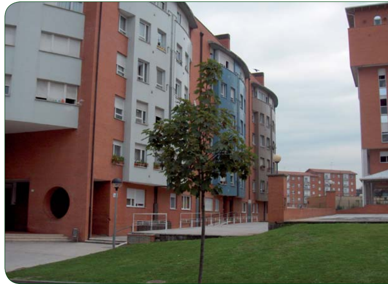
EL TRABAJO DE CAMPO DEL ESTUDIO — MAPA SOBRE VIVIENDA Y COMUNIDAD GITANA NOS LLEVÓ A TODOS LOS LUGARES DE ESPAÑA DONDE HABITA POBLACIÓN GITANA

Alrededor de 100 decisores políticos participaron en las I Jornadas de Reflexión sobre comunidad gitana y vivienda.