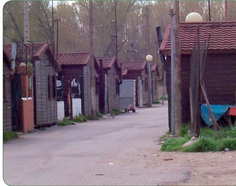
TODAVÍA UNA PARTE DE LA COMUNIDAD GITANA PADECE LOS EFECTOS DE LA EXCLUSIÓN RESIDENCIAL

ardua y exhaustiva tarea en la que dicha red se ha encargado de extraer datos de población gitana en unos 1.700 municipios españoles. Este gran esfuerzo nos va a permitir contar con una información actualizada y fiable de dónde y en qué tipo de barrios y condiciones viven hoy los gitanos españoles, siendo posible de este modo conocer las necesidades y carencias que todavía presentan.