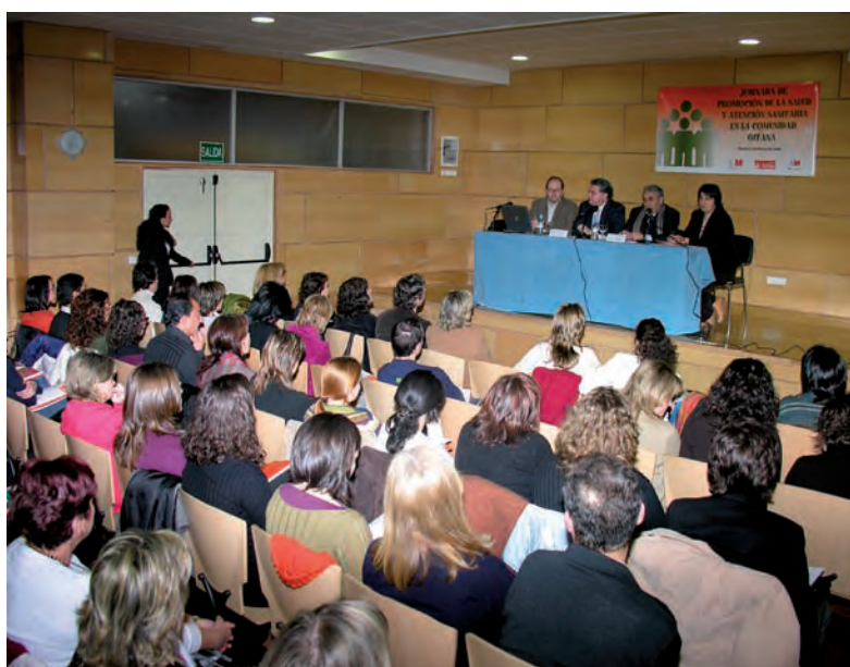
SEMINARIO SOBRE LA PROMOCIÓN DE LA SALUD DE LA COMUNIDAD GITANA, EN MADRID

de prevención y promoción de la salud, dirigidas tanto a menores, jóvenes y adultos, con un total de 2.169 personas. Esto ha supuesto un aumento importante en el número de beneficiarios y el número de dispositivos desde los que realizamos este tipo de actuaciones. Asimismo, la formación de nuestros profesionales ha sido un eje prioritario en el desarrollo de esta línea de acción y nos ha permitido