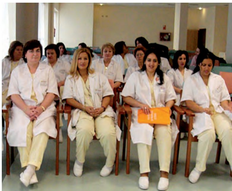
FORMACIÓN A PROFESIONALES DE ATENCIÓN SANITARIA

» Acciones de prevención y sensibilización de la población gitana con respecto al VIH-SIDA. Durante el año 2006 hemos consolidado la colaboración de años anteriores con el Plan Nacional sobre SIDA, llevando a cabo actividades