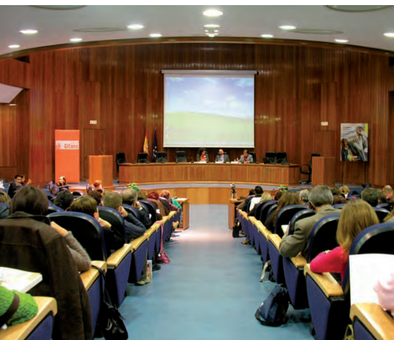
SEMINARIO EQUIDAD, SALUD Y COMUNIDAD GITANA, MINISTERIO DE SANIDAD Y CONSUMO-MADRID

marco del convenio de colaboración entre la FSG y el Ministerio de Sanidad y Consumo hemos publicado la Guía para la Actuación con la Comunidad Gitana en los Servicios Sanitarios . Esta Guía tiene como fin último contribuir al logro de reducir las desigualdades en salud desde el Sistema Nacional de Salud, respondiendo a la necesidad de que todas las personas que acceden a los servicios de salud reciban un tratamiento equitativo y culturalmente adecuado a sus necesidades específicas. Para ello, se establece una serie de propuestas de actuación orientadas a corregir desigualdades existentes en la actualidad, en relación con el acceso de la población gitana al sistema público de salud. Asimismo, y en el marco del proyecto europeo de Salud Pública Reducción de las Desigualdades en Salud de la Población Gitana , se ha adaptado esta guía al contexto y situación de la comunidad gitana en cada uno de los países participantes, con el asesoramiento de la FSG.