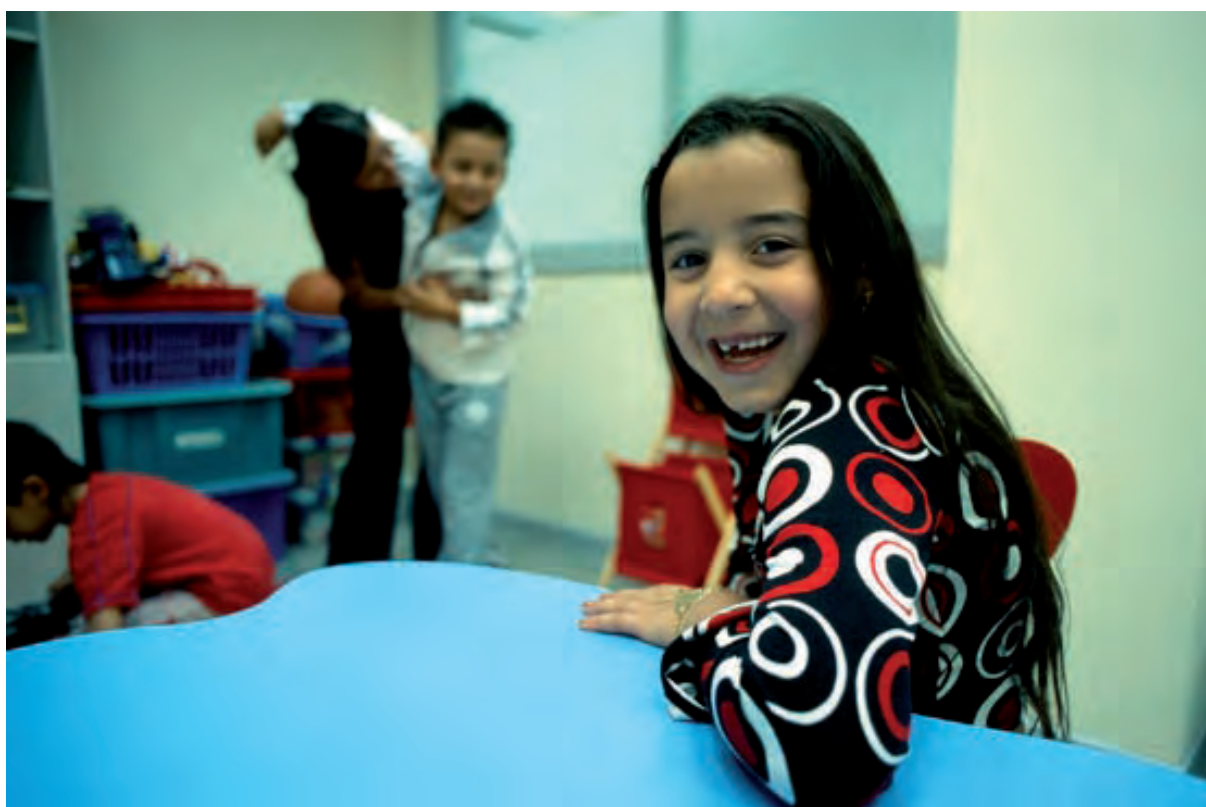
CASA DE LOS CHAVORRILLOS, PAN BENDITO-MADRID

La asistencia continuada y el logro de objetivos académicos en las etapas educativas obligatorias son retos para la comunidad gitana en la actualidad.