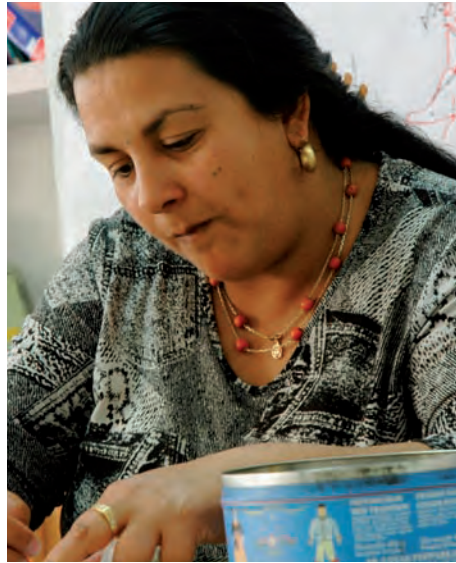
PARTICIPANDO EN UN GRUPO DE EDUCACIÓN DE ADULTOS

contextos de desventaja social. Se ha prestado especial atención al acompañamiento en el acceso y permanencia en la etapa de Educación Secundaria Obligatoria y hacia la promoción del conocimiento y promoción de la cultura gitana tanto en espacios educativos formales como no formales. En estas acciones han participado aproximadamente 9500 alumnos y alumnas gitanos, así como personal educativo.