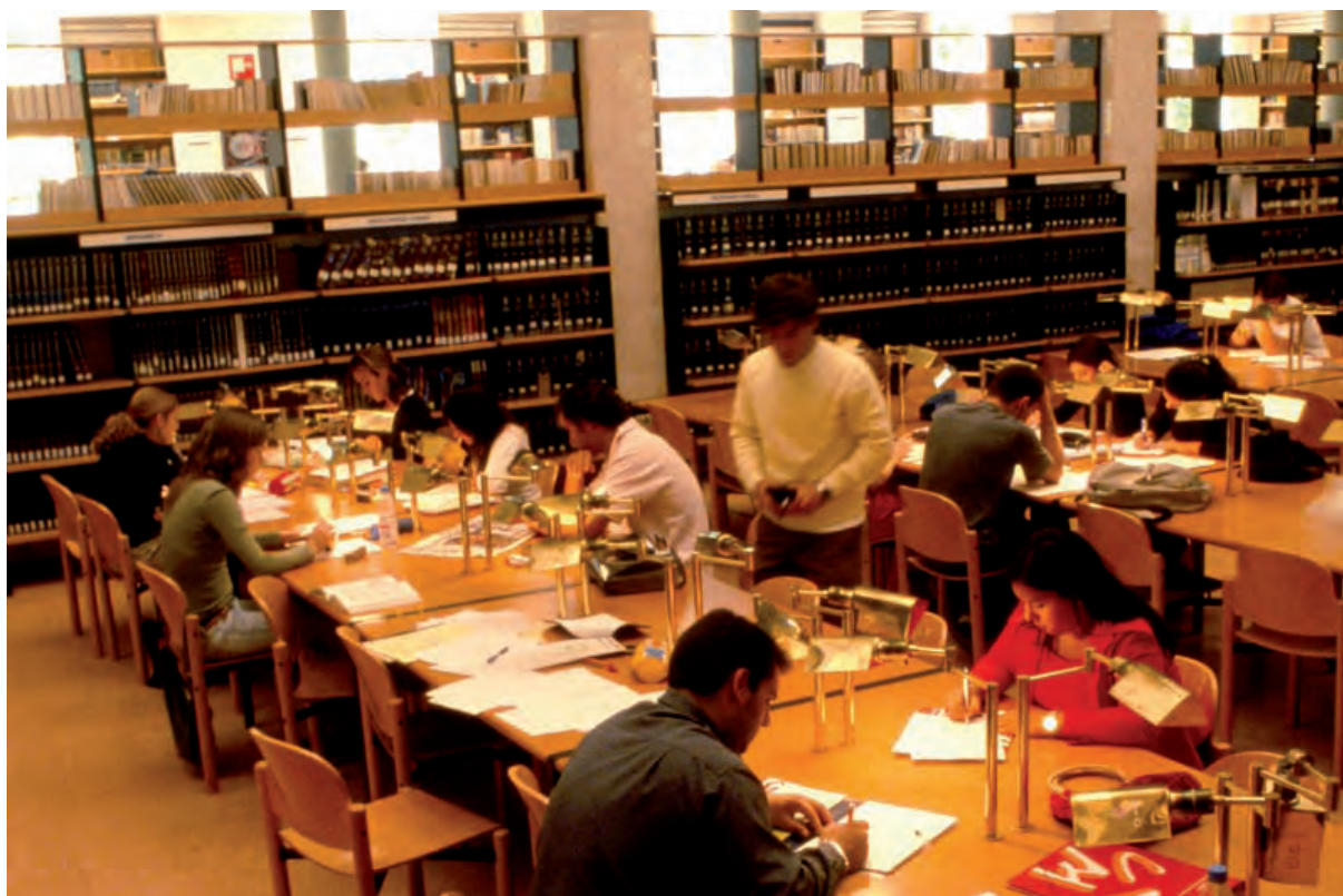
BIBLIOTECA DE LA UNIVERSIDAD COMPLUTENSE DE MADRID

obtener una formación básica, centrada por un lado en la adquisición de capacidades instrumentales fundamentales como son la lecto-escritura y las matemáticas, y por otro lado la obtención de conocimientos relacionados con cultura general y el desarrollo de competencias para el acceso al empleo. Los programas que se desarrollan en este sentido van dirigidos tanto a jóvenes y personas adultas que abandonaron prematuramente los estudios, como a quienes no accedieron a una escolarización adecuada y en el momento actual optan por cubrir esta desventaja.