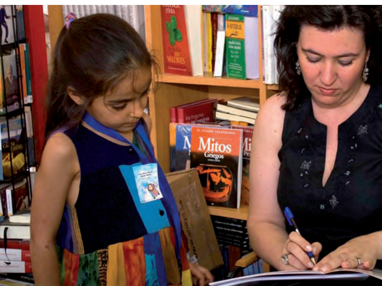
LECTURA DE CUENTOS INFANTILES, SEVILLA