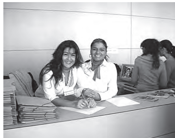
Curs d'hostesses de congressos i promotores