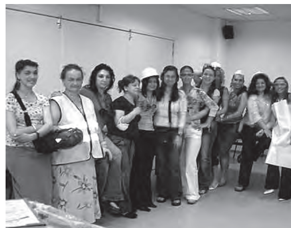
Kali activa II experta en neteja d'immobles