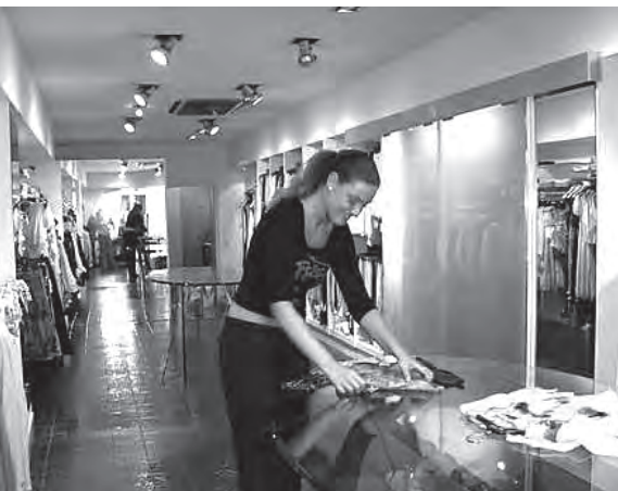
Kali activa i dependents de comerç