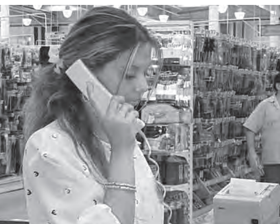
Curs de caixeres Eroski.