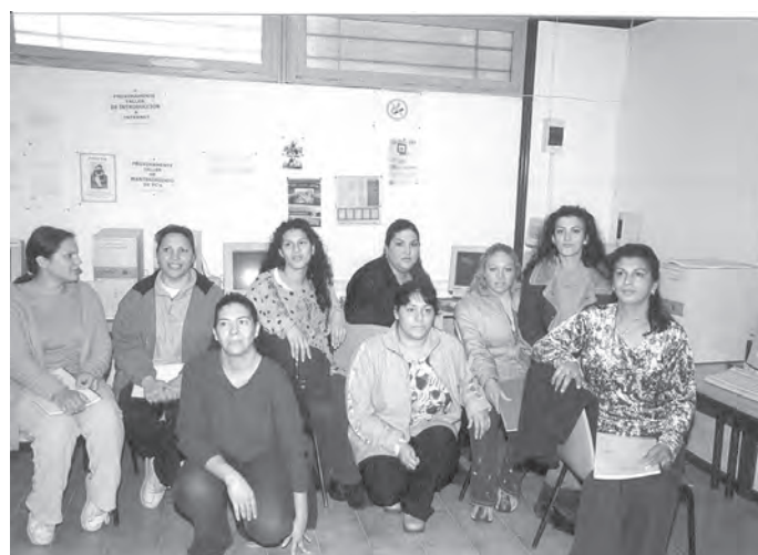
Curs d'informàtica Programa Acceder/Ajuntament Badia del Vallès

En aquestes jornades van assistir-hi dones gitanes i un bon nombre de tècnics/ques del món social que treballen directament amb la comunitat gitana; i van ser útils com a punt de partida per generar interessos de continuïtat i grups de dones que s'apropen a l'entitat amb una proposta de trobada i amb expectatives de formació, com ja comentàvem amb anterioritat.