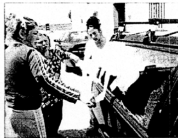
DAÑOS. Un ladrillazo rompió el cristal de este coche.