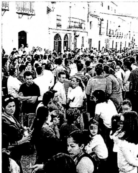
ENFRENTADOS. La comunidad gita se reunió ayer en la plaza del Ayuntamiento. Mientras, los gitanos comían las sobras de la romería.

Ayer por la tarde un cordón de la Guardia Civil, cerca de medio centenar de agentes, rodeaba el