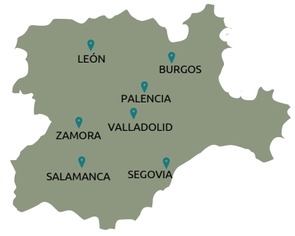
FSG-Castilla y León