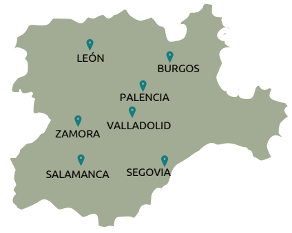
FSG-Castilla y León