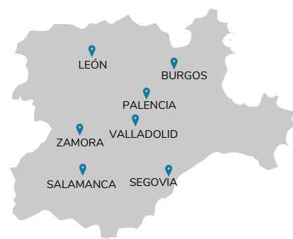
FSG-Castilla y León