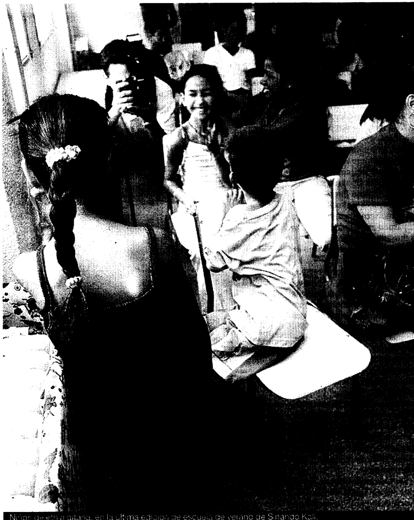
Niños de etnia gitana, en la última edición de escuela de verano de Sinando Kall.

No obstante, el estudio previene de que pese a la tendencia a la neutralidad no es conveniente ser demasiado optimistas. Si por un lado, los periodistas evitan las expresiones racistas que han estado arraigadas en el lenguaje, por otro, en escasas ocasiones consultan las fuentes gitanas. Además, las noticias relativas al pueblo gitano están ligadas a secciones informativas determinadas. Por lo general a las de crónica negra relacionadas con homicidios o agresiones, problemas de realojos o de convivencia. También son objetivo de la prensa del corazón, donde algunos artistas gitanos tienen un especial protagonismo. ■