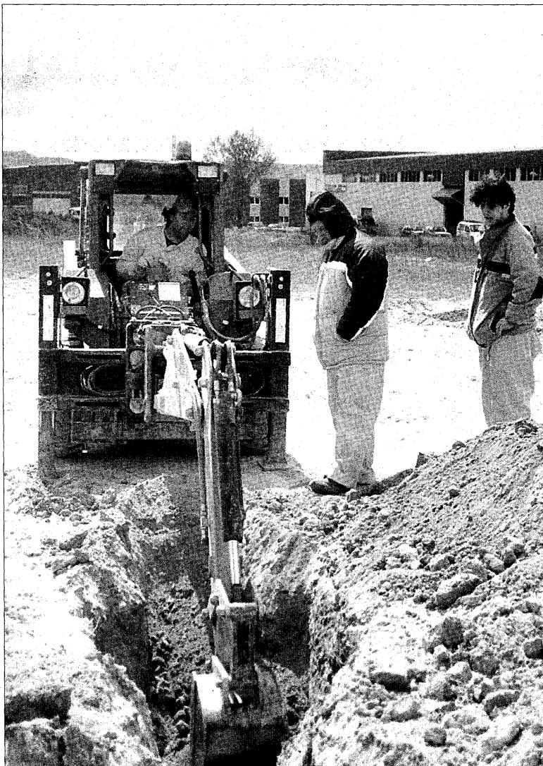
El curso de retroexcavadora ha sido uno de los preferidos por los alumnos de la FSGG.

«A la gente se le quedó corto. Les hubiera gustado tener más horas de práctica para poder manejar a la perfección la máquina. Pero según nuestro técnico era lo suficiente para saber desenvolverse