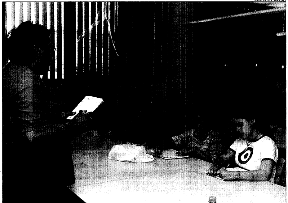
Los alumnos atienden a las explicaciones del profesor sobre cómo hablar y escribir en el idioma caló.