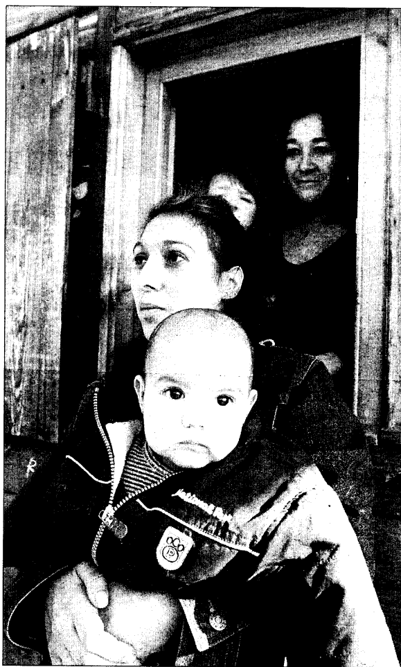
Residentes de Las Graveras a la puerta de la casa prefabricada

«Llega el programa de realojo a Las Graveras porque pasa una carretera por el medio», dice resignado un ex residente del gueto. Las viviendas prefabricadas fueron proporcionadas en septiembre de 1991 por el Ayuntamiento tras casi dos años de denuncias y 16 desde que fueron levantadas por familias desposeídas; corrían los años 70 y, entre otros materiales,