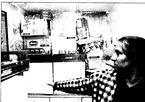
Una vecina muestra su cocina en una casa de La Veguilla

se utilizaron los restos de vallas publicitarias de las primeras elecciones democráticas que se celebraron en España.