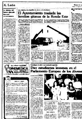
Noticias publicadas los días 31 de agosto y 22 de diciembre de 1991

cada hogar. Los realojos serán escalonados en tres años pero todavía no se ha tomado la decisión sobre si la solución pasará por alquileres o compra de viviendas. Lo que sí tiene claro la concejala es que no debe trasplantarse a otra zona. Unos residentes quieren irse juntos y otros prefieren no ser vecinos por más tiempo.