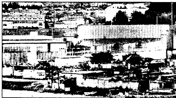
En el poblado de la Conservera Celta viven más de cien familias

Según afirmó ayer la concejala de Asuntos Sociales, Aurora Moinelo, en los próximos días se celebrarán reuniones entre las concejalías y departamentos implicados para trazar el plan que permitirá mejorar la calidad de vida de las más de cien familias que viven